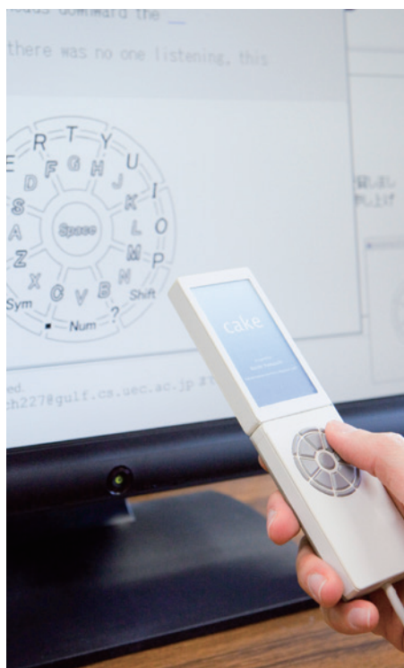
新しい入力装置ハンドヘルム

この片手入力キーボードを発展させた形の一つがハンドヘルムである。この入力装置は、円形に配置されたボタンに子音と母音を割り振っており、片手で入力することができ、しかも、ボタンは圧力センサーを採用することでカーソル操作や文字の削除等の機能も利用することができる。さらに、内部には横方向の動きを取るためのジャイロと縦方向の動きを取る加速度センサーが装備されており、Wiiriモコンのような操作を可能としている。実際に携帯電話を利用して人なら1時間ぐらいで操作を習得することができるという。